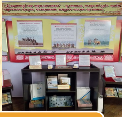
Жазушының мерейтойлық медальдары