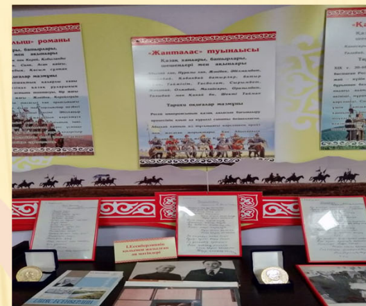
І.Есенберлиннің қолымен жазылған ән мәтіндері