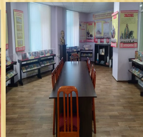
2017 жыл сәуір