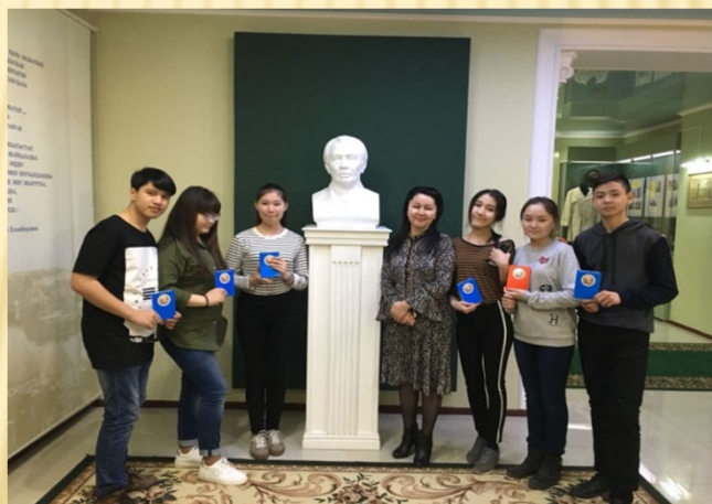
Атбасар қаласындағы І.Есенберлиннің әдеби музейі