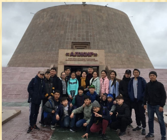
9 сынып оқушыларынан құралған «Ұлы дала елі» тобының мүшелері