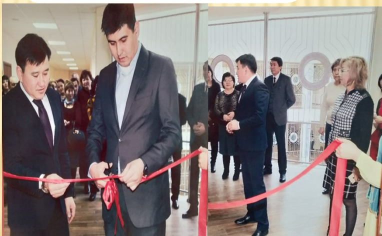
2015 жыл қаңтар