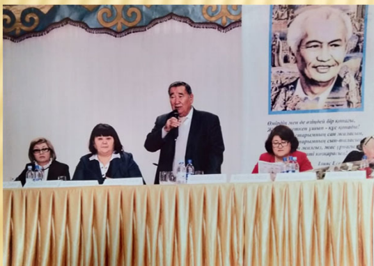
2011 жыл желтоқсан

2017 ж. Елбасы Н.А. Назарбаевтың «Болашаққа бағдар: рухани жаңғыру» бағдарламасын іске асыруда мұражай қоры жазушының тарихи шығармаларымен толықтырып, қайта жаңғыртылды.