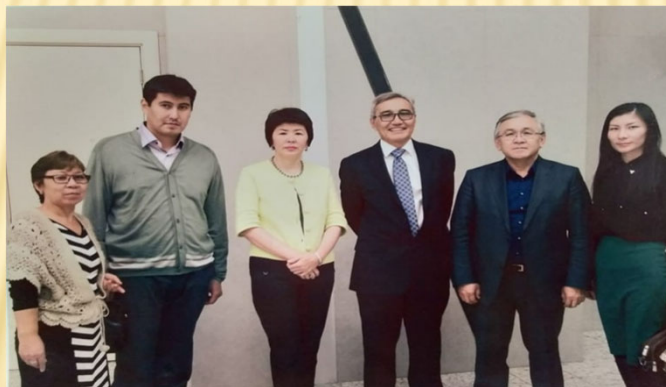
І.Есенберлинұлы Қозы Көрпеш, І.Есенберлин немересі Мағжан