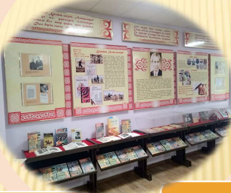
І.Есенберлиннің кітаптар топтамасы