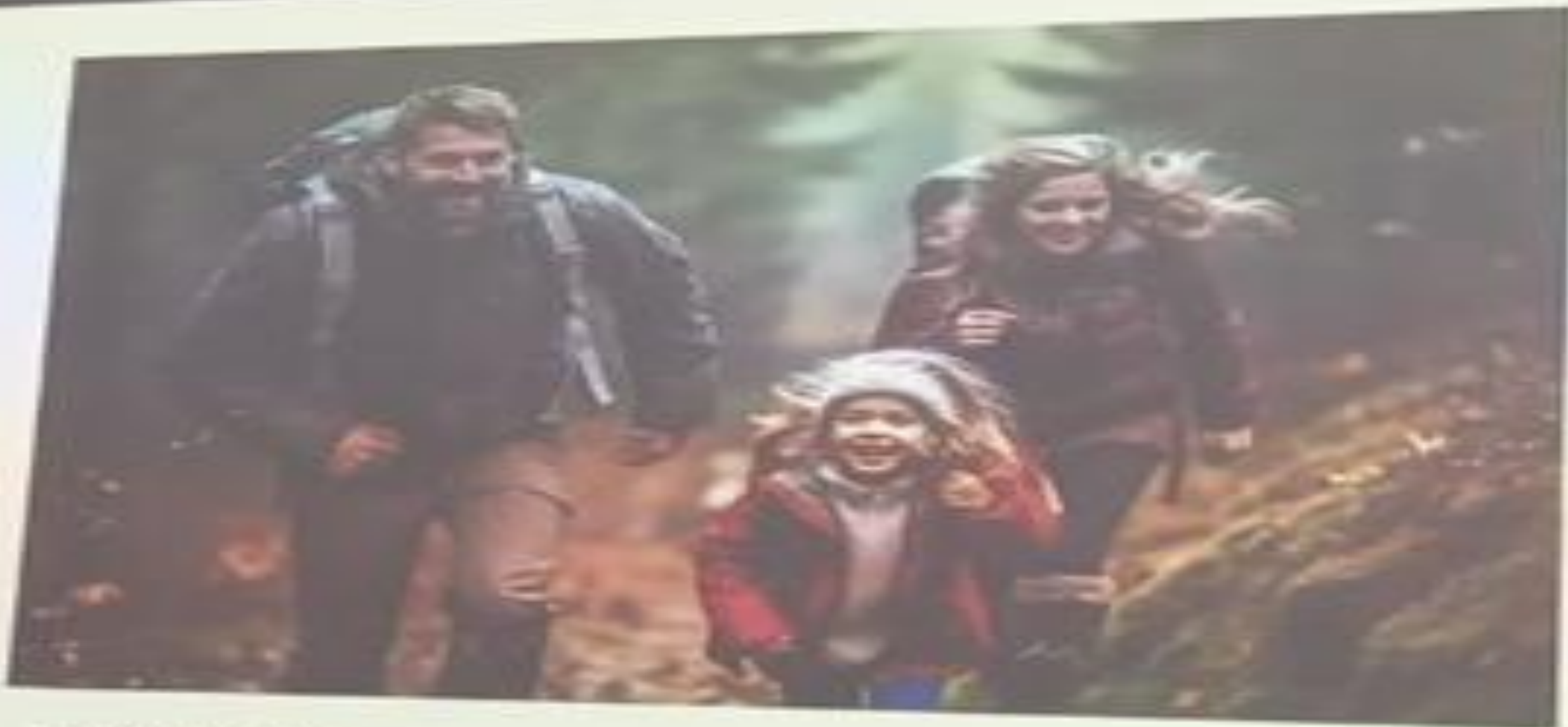
Барлық отбасы мүшелерінің жеке шекараларын сақтау және олардың таңдауларын құрметтеу