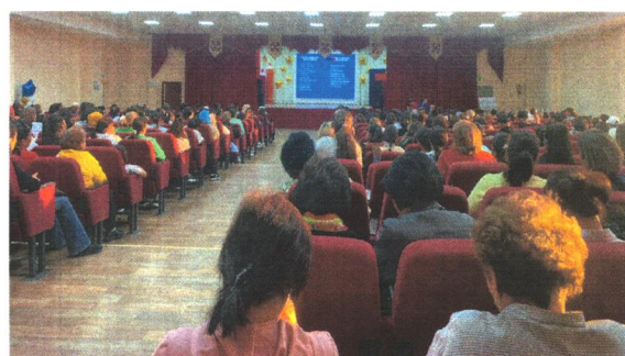
Жалпы ата-аналар жиналысы 1- бөлім