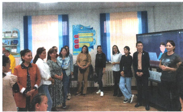
«Ата-аналардың медиация орталығы»