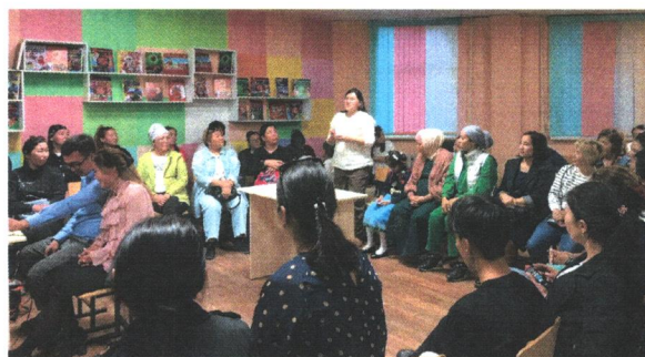
«Мектеп-отбасылық құндылықтарды қалыптастыру»