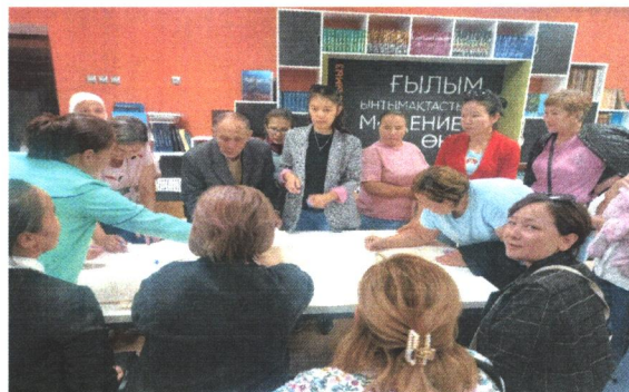
«Отбасылық оқырмандар» клубы